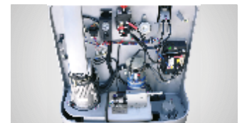
Figura 2 - Tração