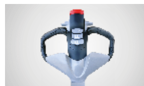
Figura 1 - Timão